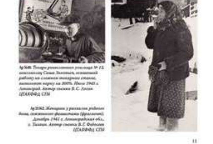
Архив ЦГА. Женщина у рудника в районе Выборга, Ленинградская область, 1942 г. Ленинградская обл., Выборг. Автор снимка В.С. Фадеев ЦГАКФФД СПб