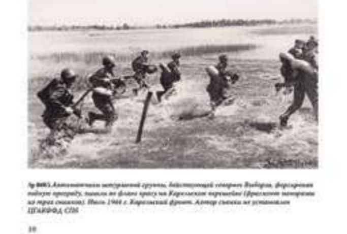
Архив ЦГА. Автоматическая винтовочная группа, действующая в тылу Выборга, форсированно выдвигаясь вперед, выходя на фронт в тылу на Карельском перешейке (Ленинградская область) в тылу Выборга, 1944 г. Карельский фронт. Автор снимка не установлен ЦГАКФФД СПб