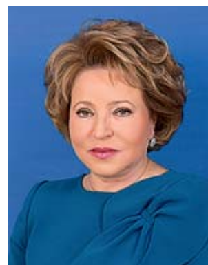
Валентина Матвиенко, Председатель Совета Федерации:

Этому дню не грозит забвение, и живые цветы всегда будут ложиться к скорбным холмам братских могил Пискаревского кладбища, где покоятся свыше 520 тысяч человек. Это самое большое в мире кладбище жертв Второй мировой войны. 9 мая – в День 70-летия Победы, мы отметим и 55-летие этого мемориала – памятника, напоминающего нам о величайшей общечеловеческой трагедии, которая не должна повториться.