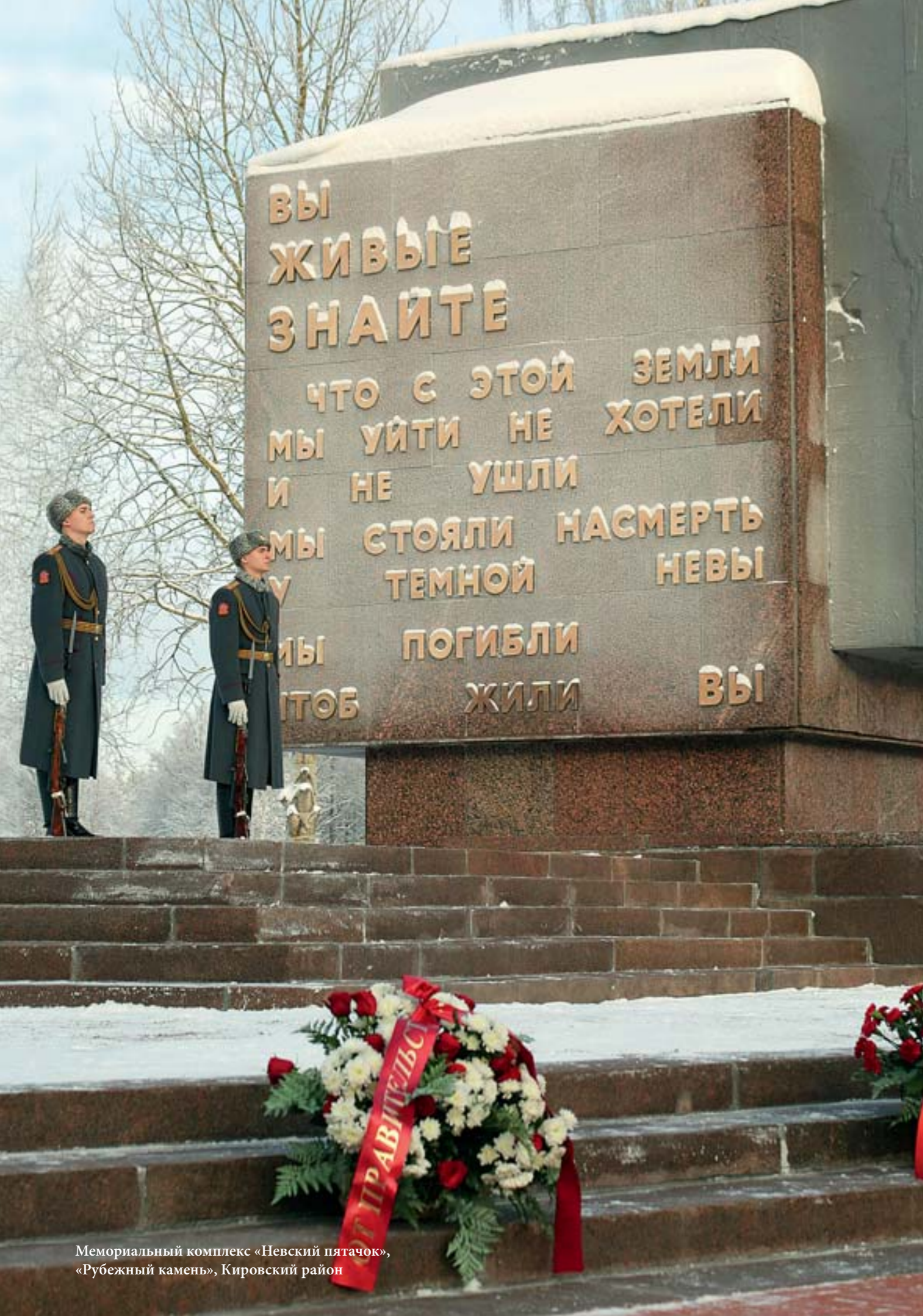
Мемориальный комплекс «Невский пяточок», «Рубежный камень», Кировский район