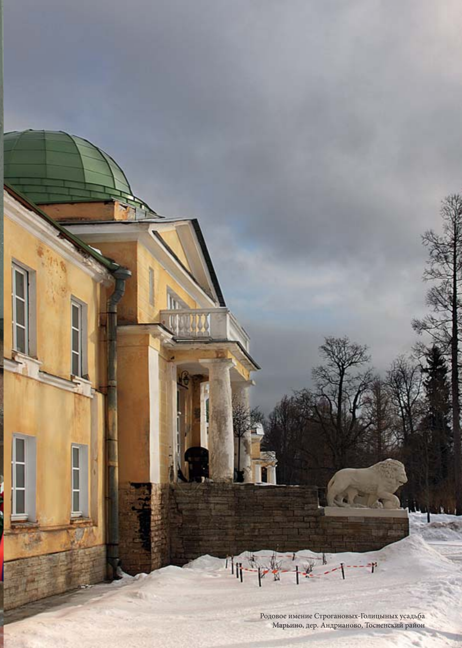
Родовое имение Строгановых-Голицыных усадьба Марьино, дер. Андрианово, Тосненский район