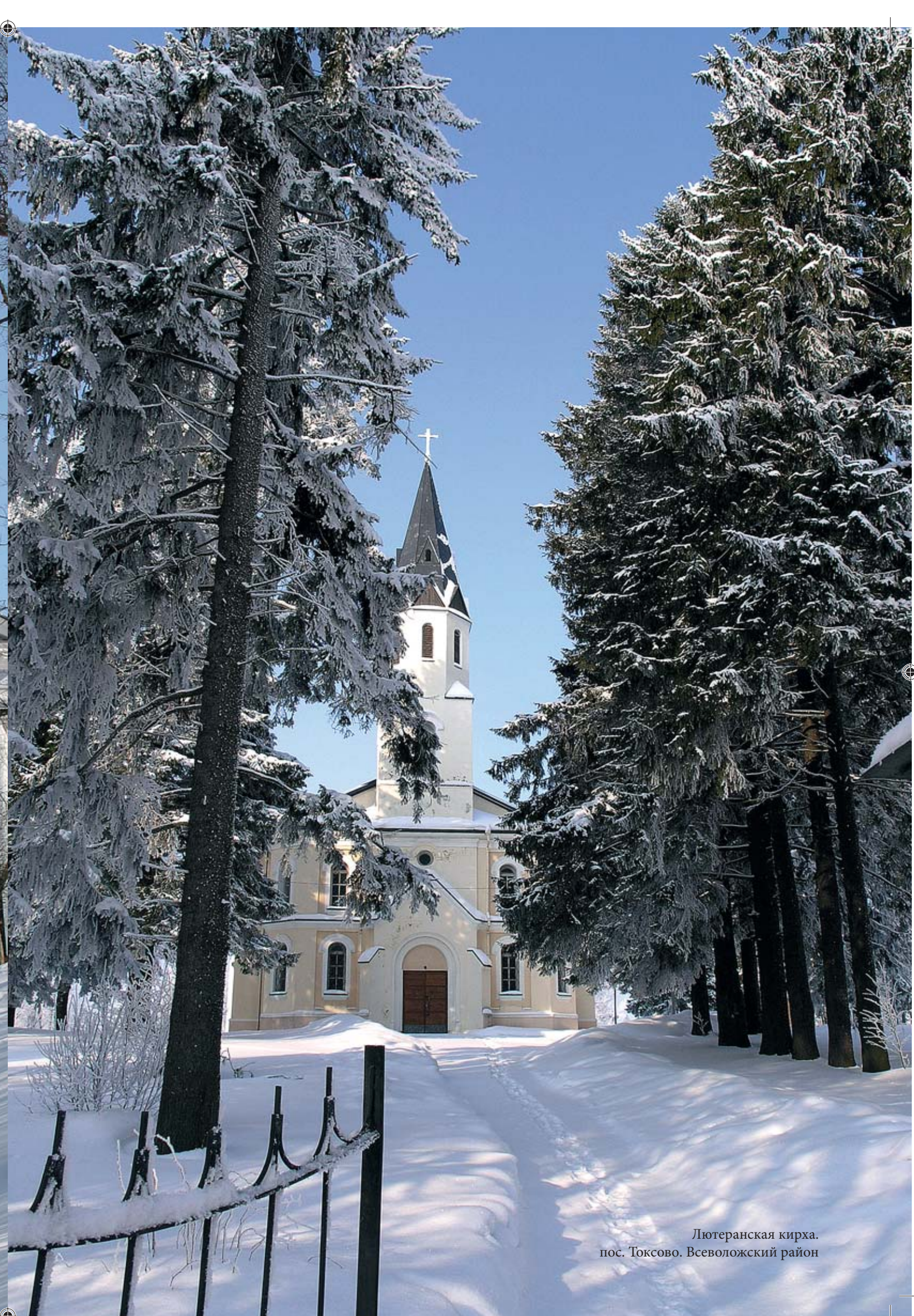
Лютеранская кирха. пос. Токсово, Всеволожский район