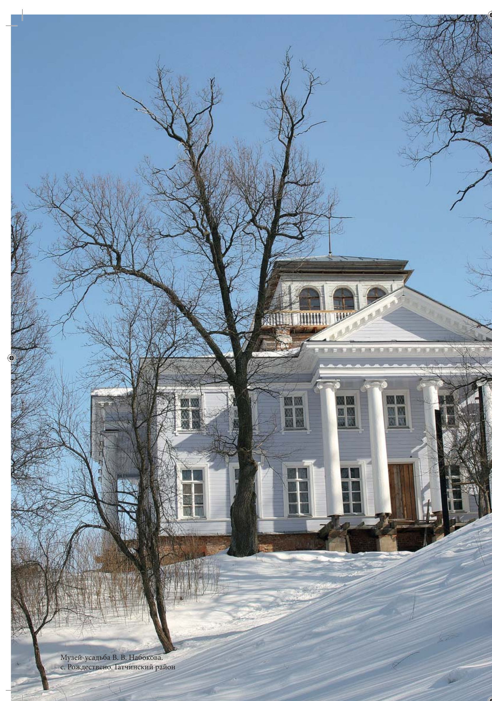
Музей-усадьба В. В. Набокова. с. Рождествено, Гатчинский район