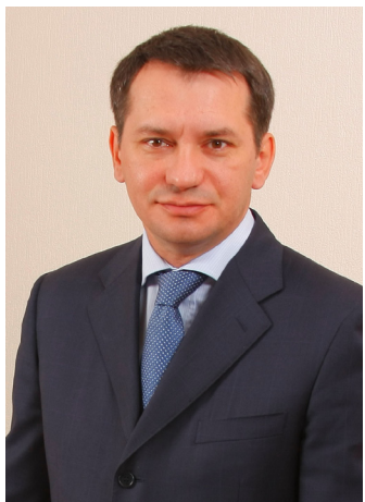
Герман Мозговой, заместитель председателя Законодательного собрания:

– Этот праздник не только по причине дня рождения Ленинградской области, но еще и потому, что реально улучшились показатели. Это говорит о том, что все антикризисные меры, которые предпринимались Правительством и Законодательным собранием, оказались эффективными и результативными. Это главный итог.