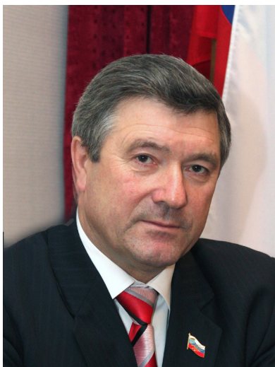
Председатель Законодательного собрания Ленинградской области Иван Хабаров:

– День Ленинградской области – это отчасти подведение промежуточных итогов года. Если вести отсчет от 1 августа прошлого года, то надо вспомнить, что мы переживали трудный период начала и конца 2009 года. Уже приводились цифры, что за первое полугодие экономический рост составил 9,4%, мы практически сравнялись с докризисным уровнем по индексу промышленного производства. Область живет, развивается и, уверен, будет развиваться дальше, чтобы люди не почувствовали тех катаклизмов, которые происходят в мире.