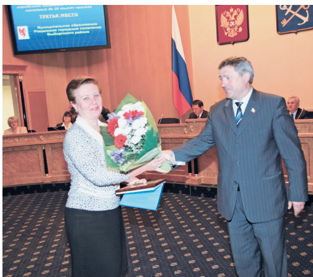
Главам муниципальных образований были вручены Почетные грамоты Законодательного собрания Ленинградской области и ценные подарки