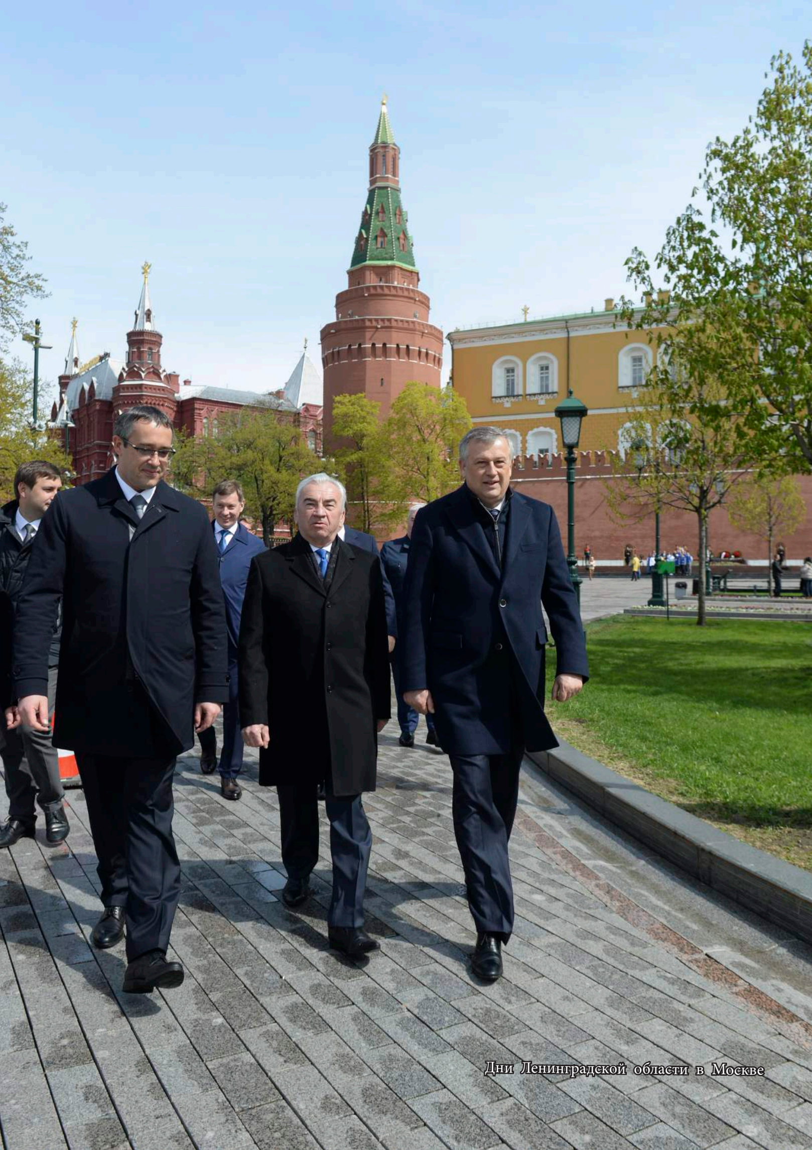
Дни Ленинградской области в Москве