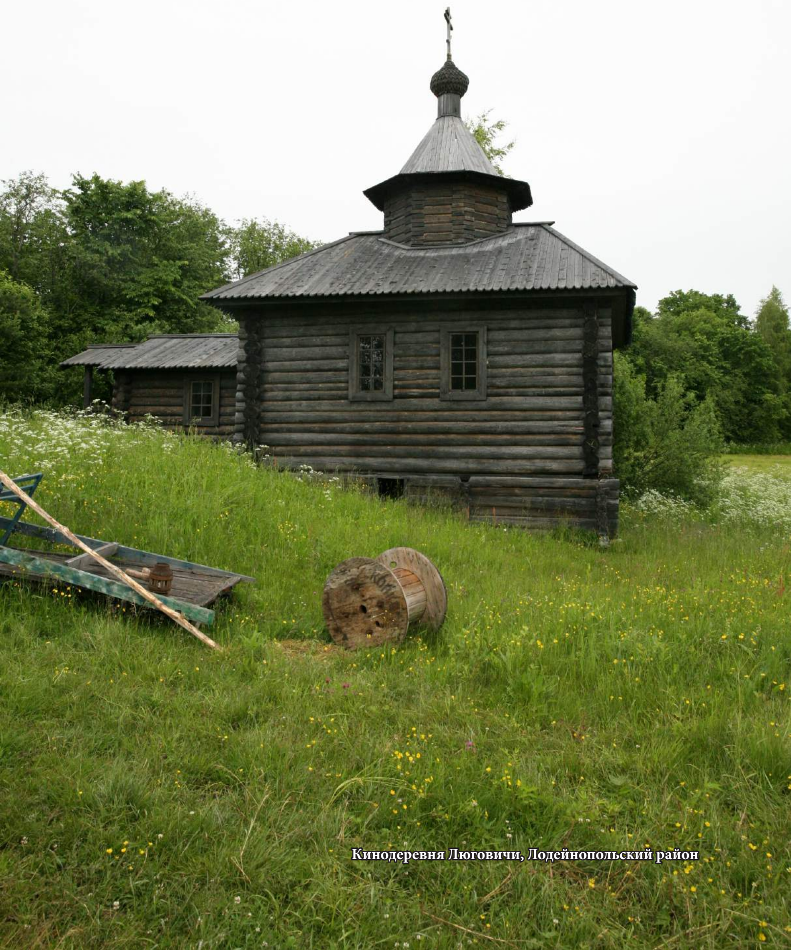
Киноедервня Люговичи, Лодейнопольский район