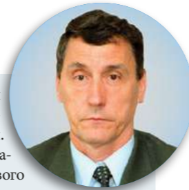
Георгий САМСОНЕНКО, депутат Законодательного собрания Ленинградской области первого, второго и третьего созывов:

«Мы все первые годы работали на неосвобожденной основе, я был первым заместителем главы администрации Волховского района. Так что груз проблем был вдвойне тяжел – решать все эти жизненные головоломки приходилось еще и как первому заместителю Председателя Законодательного собрания.