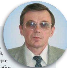
депутат Законодательного собрания Ленинградской области второго и третьего созывов:

«Будучи депутатом, я объездил все самые отдаленные деревни, знал положение в них, понимал, что перемены давно назрели. О необходимости реформы местного самоуправления в стране, в области не говорил тогда только ленивый или равнодушный. Но мало было просто говорить, нужны были реальные, конкретные шаги к реформированию. Законодательная база местного самоуправления была очень слабой, нужно было практически начинать с нуля. Вместе с депутатами мы объехали немало регионов, где в порядке эксперимента «обкатывали» новые модели местного самоуправления: Ярославль, Свердловская область, Чебоксары, Псков... Знакомились с чужим опытом, анализировали, осмысливали, впитывали всё лучшее, что было у соседей.