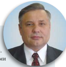
депутат Законодательного собрания Ленинградской области второго и третьего созывов:

«Работа в областном парламенте требовала широкого, масштабного видения проблем и путей их решения. Во многом благодаря деятельности депутатского корпуса региону тогда удалось сделать настоящий прорыв в экономике. Был принят ряд важнейших законов, касающихся инвестиционной деятельности, региональных целевых программ. Это был сложный период начала реформы местного самоуправления, формирования новой модели межбюджетных отношений. Наряду с экономическими вопросами в поле зрения депутатов постоянно находились и вопросы социальной сферы.